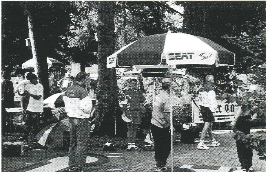
Der var trangt på anlæggene - men ellers var forholdene i top.

De danske spillere var meget velforberedte og opsatte inden afgang