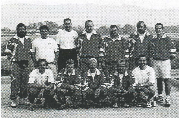
Årets herrelandshold levede helt op til forventningerne.

Næste års internationale mesterskaber er europamesterskaberne, som spilles i Portugal.