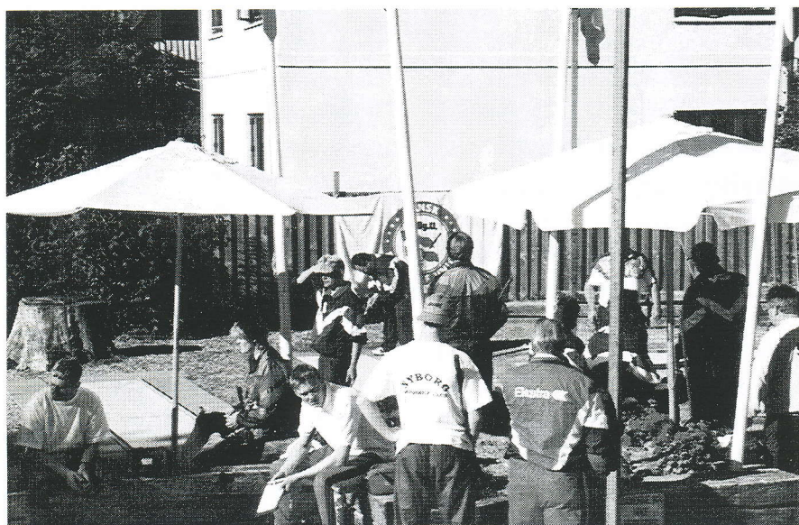
En situation mange klubber drømmer om til deres stævner - anlægget fyldt!

Jeg tror det er på tide, at klubberne vågner lidt op og begynder at markedsføre deres arrangementer lidt bedre og ikke forsøge at lægge hele ansvaret for sportens fremtid over på unionen. Her tænker jeg primært på, at indbydelserne bør komme meget tidligere end standarden er i dag, og at lidt udvikling i stævneformen ikke kan skade, slet ikke når stort set alle klubber klager over lave deltagerantal.