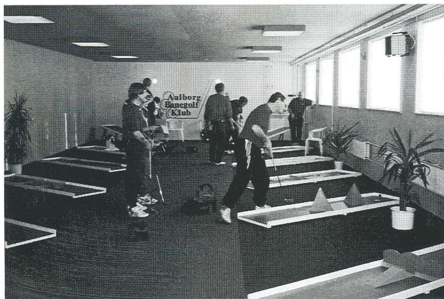
Selvom tilslutningen i år var temmelig lille, var stemningen og konkurrence i top ved Aalborg Banegolf Klubs indendørsstævne.

til spillerens psyke end det mere statiske spil, der bliver kendetegnet i løbet af 6-10 runder i træk.