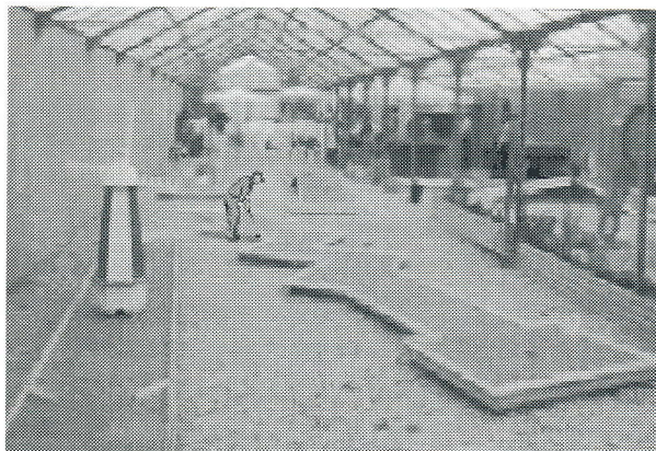
Et lille udsnit af anlægget i det gamle gartneri på Orø.

Banerne er store filtbaner (ikke standard) anlagt i nogle nedlagte drivhuse. Der er sikret god ventilation, der gør at temperaturerne denne dag var acceptable. Banerne var utraditionelle. De stillede store krav til præcision og tempo. Banerne bærer navne som: Zig Zak, Møllen, Sildebenet, Engbakken, High Tower, Udsigten, Hønsehuset, Sandgraven, Rusen, Kirken. Spillerne havde på den korte tid til træning allerede lært trækket på de forskellige baner. Banerne stillede store krav til spillerne. Der blev påtalt enkelte småfejl, der skal rettes. Det er en spændende tanke, at der en dag kan spilles en holdturnering på banerne. Udenomsfaciliteterne var tip top. Der var mange borde og stole, toiletter, kiosk med stort udvalg og varm mad. Klubdannelsen er i fuld gang og indmelding i DMgU nær forestående. Vi glæder os til at byde Orø Minigolf Klub velkommen i DMgU.