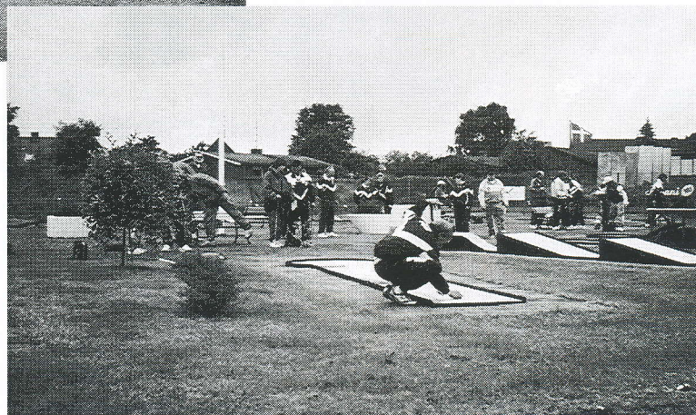
Sådan burde det have været fyldt op med deltagere på Nord-Als.

unge hene, som kom til den før-omtalte landsholdssamling? Har vi lige pludselig mistet dem?