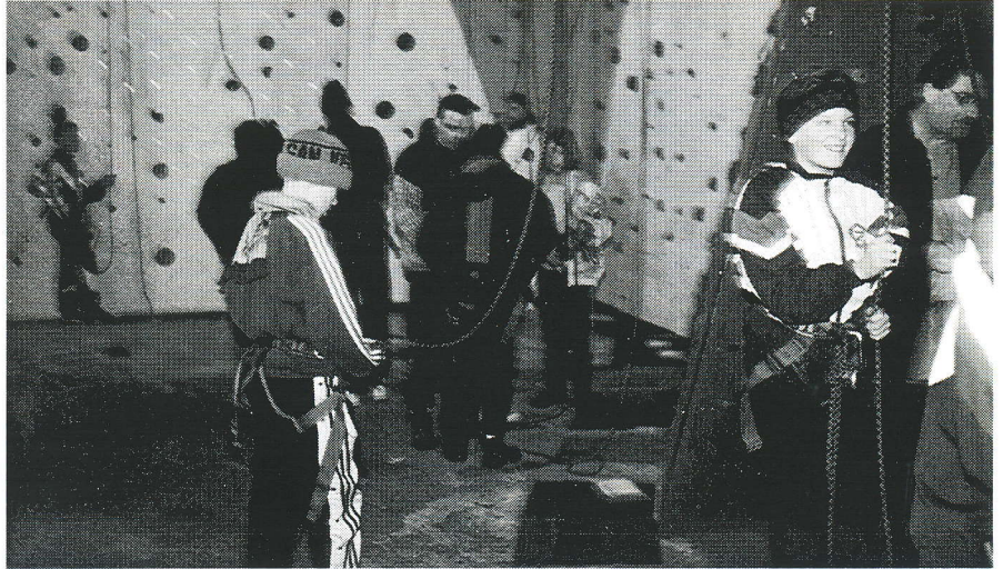
Fra ungdomstræffet for 2 år siden i Odense, hvor de blandt andet var i klatrehal.

Formålet med et juniortræf er ikke kun at få spillet en masse minigolf. Det er i lige så høj grad at få skabt kontakter og socialt samvær samt at give deltagerne en rigtig god oplevelse, som de