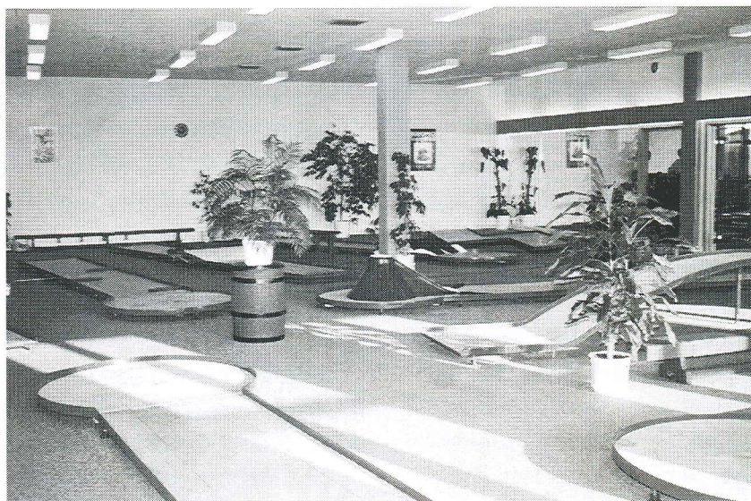
Banerne ligger tæt hos Putter Team Odense, men med lidt hensyn er der ingen problemer ved at afholde stævner.

Hvis navnet Danish Open ikke er besat til anden side, vil vi forsøge at afholde stævnet i 1997.