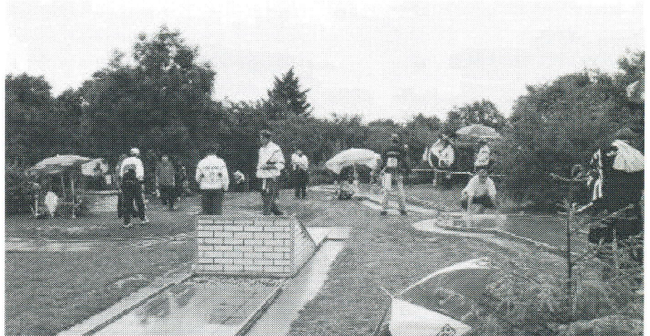
Fredag startede med regnvej og spillet blev udsat en time. På trods af vejret blev alle runder for dagen gennemført uden øvrige problemer

Heldigvis kom vores drenge igen, og sluttede dagen med hver en omgang 20 på eternitten, herligt for