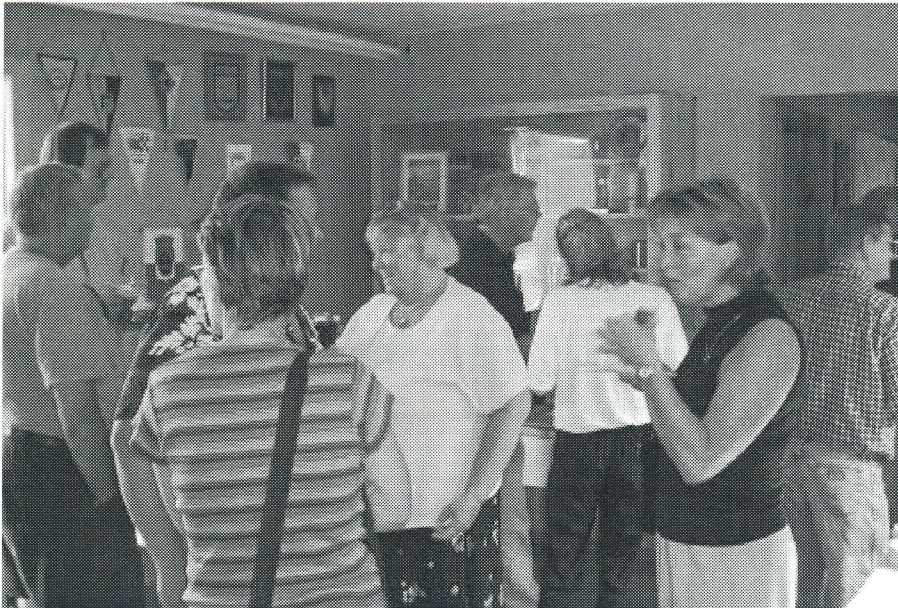
Stemning og snak på tværs sammen med pindemadder og fadøl. Det gamle klubhus var desuden på dagen omdannet til et museum.

sammenslutning og fra kommunens idrætsansvarlige område.