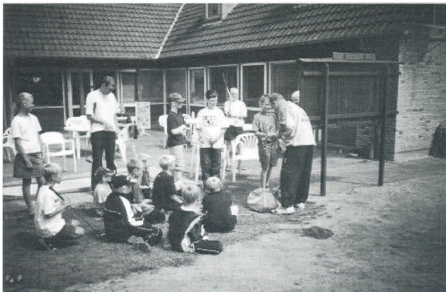
Der var stor opbakning omkring deltagerne ved SIF's første minigolf-skole.

Minigolf-skolen er sådan en fantastisk idé, at den kunne bruges i alle Danmarks minigolf-klubber.