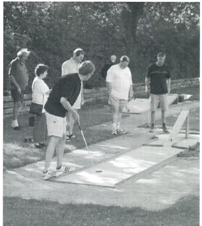
Jo, de var på banen igen alle de gamle klubkammerater. Flere af dem er aktive idag 40 år efter de startede karrieren.

Allerede i år har den øgede sværhedsgrad på anlægget kombineret med forskellige spilformer skabt liv og træning, og det håber man naturligvis at bevare for at kunne tilbyde dels et socialt samvær men også masser af spil og forskellige konkurrenceformer. Der er hermed gjort forberedelser til de næste mange år frem.