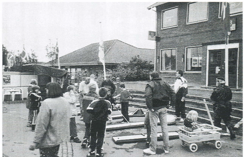
Glimt fra Gelsteds promotion på det lokale torv

Efterfølgende har vi skriftligt takket hver enkelt sponsor og allerede nu bedt om deres hjælp til MINIGOLFENS DAG 1999 , så fundamentet for en god aktivitet skulle dermed være skabt.