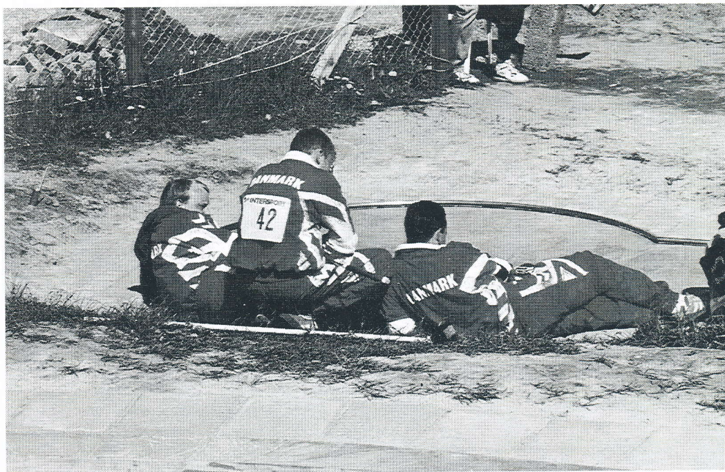
Alle kneb gælde! Her et tæt samarbejde på det danske hold for at skærme for vinden.

Der var som sædvanlig tidsproblemer på betonen, hvilket gave en forsinkelse på 1 time om lørdagen. Derfor blev der søndag også indført en tidsdommer på Langbanen. Denne havde bemyndigelse til uddeling af henstillinger og advarsler, hvis spilleren brugte for lang tid. Dette medførte da også 5 henstillinger men resulterede for stævnet heldigvis i, at tidsplanen blev overholdt næsten på minuttet. Til EM er det meningen at man vil stationere tidsdommere på 2 baner for at holde tidsplanen. Der blev ud over brud på tidsbegrænsningen kun uddelt yderligere en henstilling som følge af megen råberi, mens ingen spillere blev idømt advarsler.