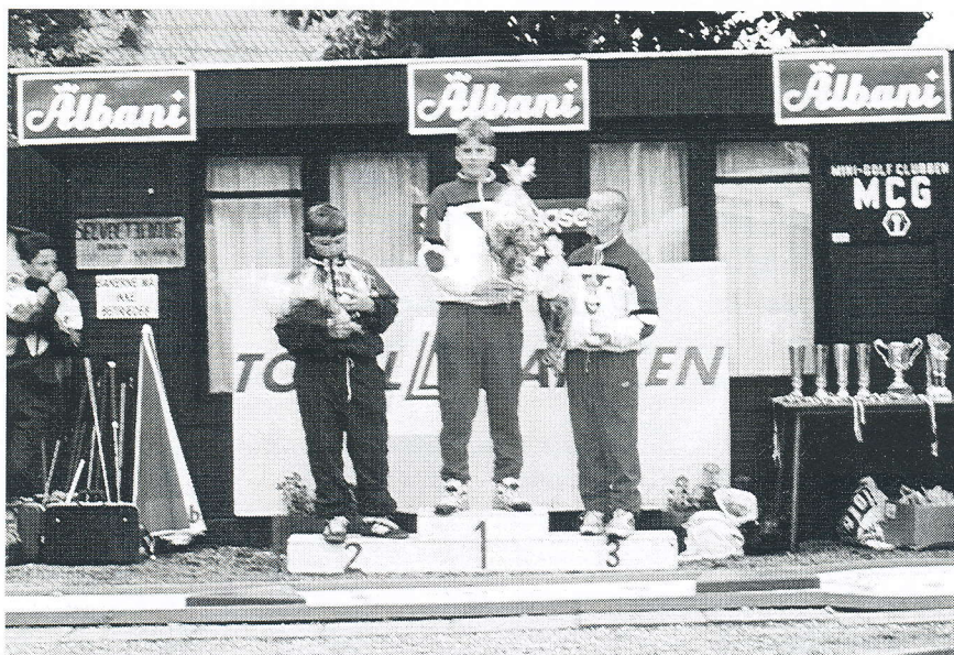
Tre stolte unge fyre på skammelen i minijuniorrækken