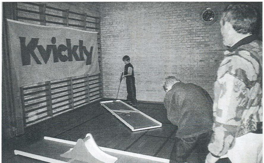
To af de seje unge knægte er her i aktion. De var trætte men det var det hele værd.

Man kan også kigge ned i Balle skolens lille gymnastiksal på fredage fra kl. 19.00 til 22.00.