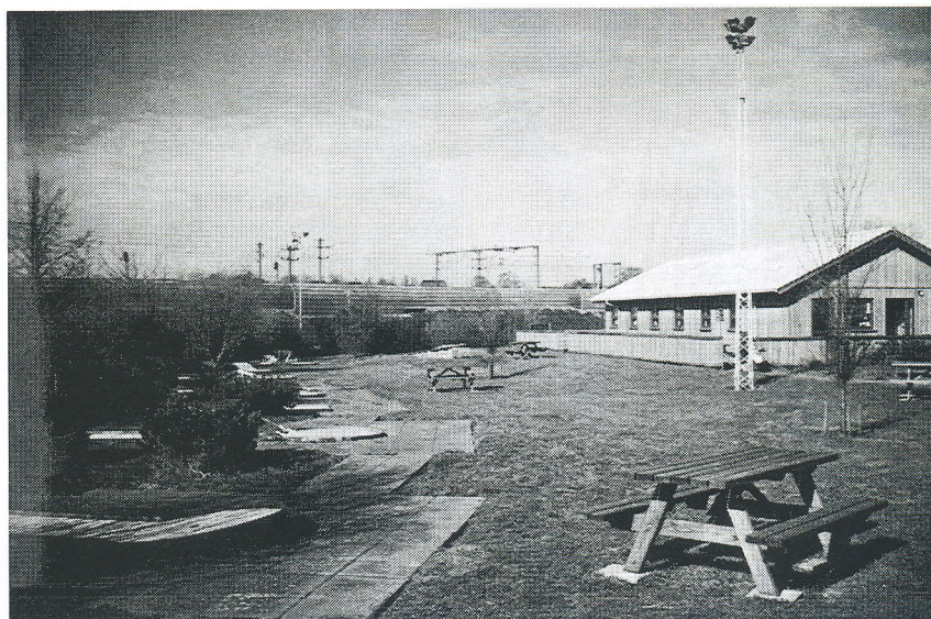
Et sidste blik ud over grunden og banerne. Ingen ved om man igen får et blik ud over banerne i Nyborg.

Hvad der sker i det videre forløb, kan han dog ikke enerådigt