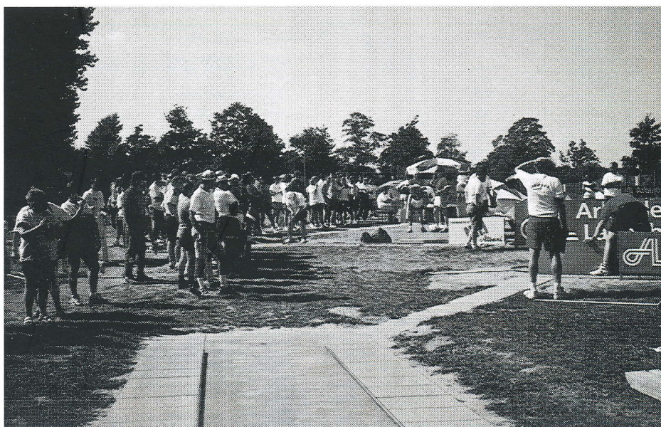
Sidst der var stor mediebevågenhed var i 1996 under EM i Odense.