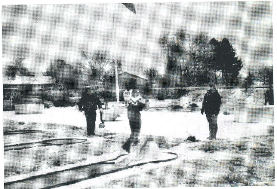
Lørdag morgen vågnede vi op til et snedækket Nord-Als, og det var en glad formand, der kunne byde samtlige deltagere velkommen.

Efter præmieoverrækkelsen blev der budt på de traditionsrige gule ærter med kålpølser og flæsk og deltagerne kunne i hyggeligt samvær få snakket sammen om hvad man forventede sig af den kommende sæson. Hvilke stævner man kunne tænke sig at deltage i og ikke mindst holdturneringen, som jo ser ud til at skulle starte her på Nord-Als i weekenden 21. og 22. april 2001.