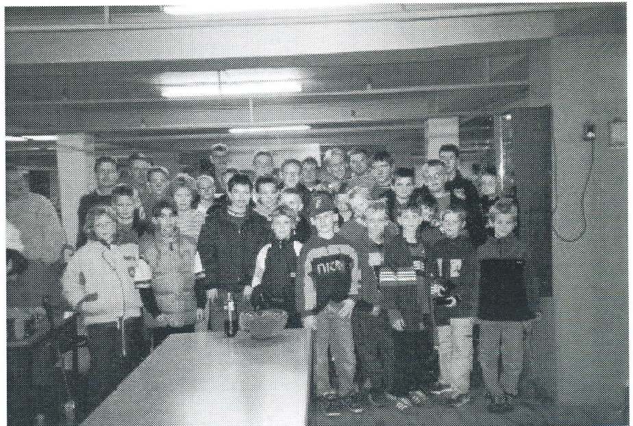
For dem der så har været med på minigolf-skolen, kan jo fortælle det videre, og så bliver der endnu flere.

Jeg synes også at man skal have en liste over klubberne i Danmark, hvis man nu fik lyst til at melde sig ind i klub. Jeg synes også at trænerne skal have noget sådan at man kan se at de har været minigolf-skoletrænere, det kunne være: En minigolf-skolejakke, en minigolf-