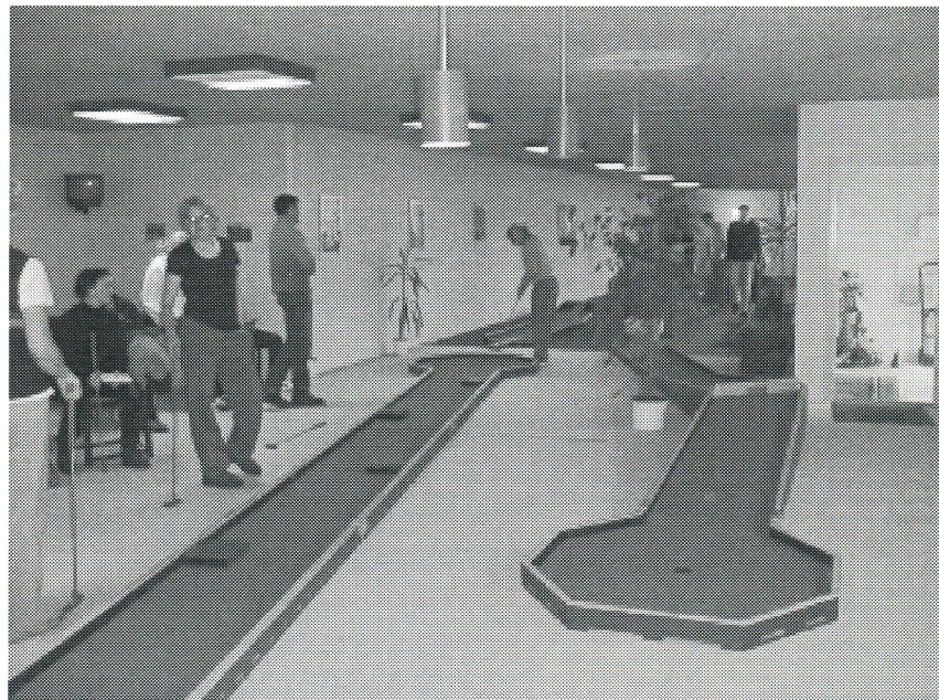
Fra lokalerne i Aalborg, hvor de har fået plads til 12 nye filtbaner.

På Nord-Als afholder de vinterstævne den 20. januar.