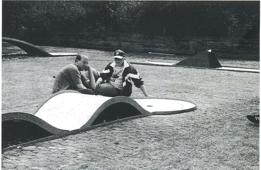
2 spillere i et slags samarbejde ved Dobbeltbakterne i forsøget på at skærme for vinden. Og til fælles havde de også de meget vigtige slag og points at kæmpe for.

Men flere af klubberne har tilmeldt 1 hold mere i forhold til den netop afviklede turnering, og så er det meget positivt at kunne konstatere, at en af sæsonens nye klubber, Hole in One Silkeborg, stiller med 2 hold.