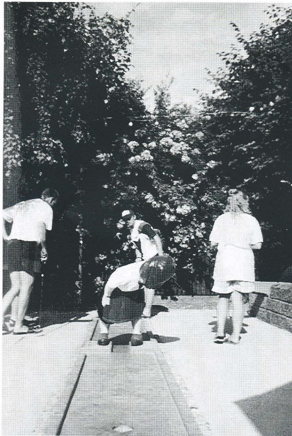
Det var næsten baner som denne fra Smørmosen på Thurø, der blev spillet på. Tilbage i 1959 var der faktisk DM på Thurø-banerne.

Heldigvis skulle man ikke bruge så mange bolde for cementen