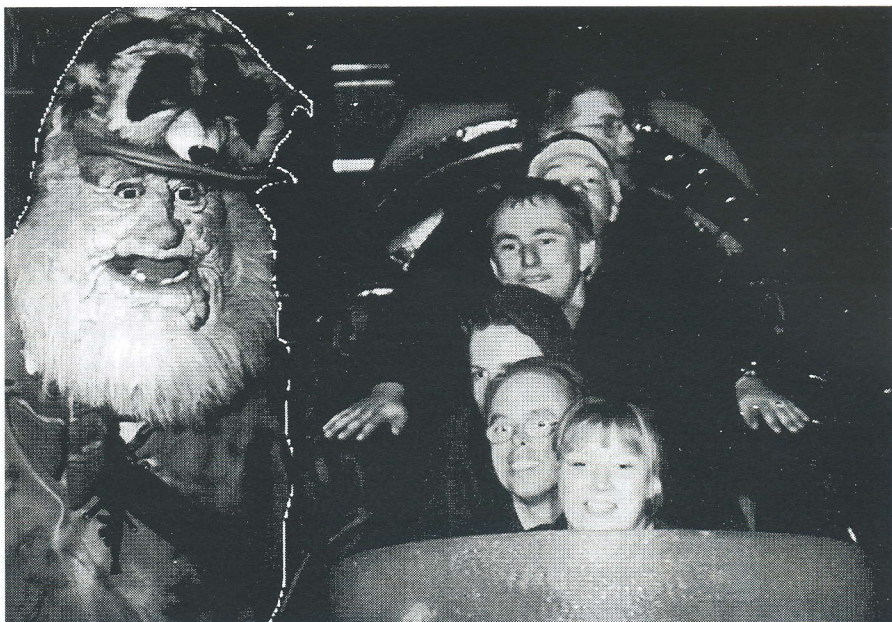
Vi er alle i samme båd her i vandrutsjebanen, og jo - flere blev godt våde.

Tak til alle og ikke mindst vores tyske værter.