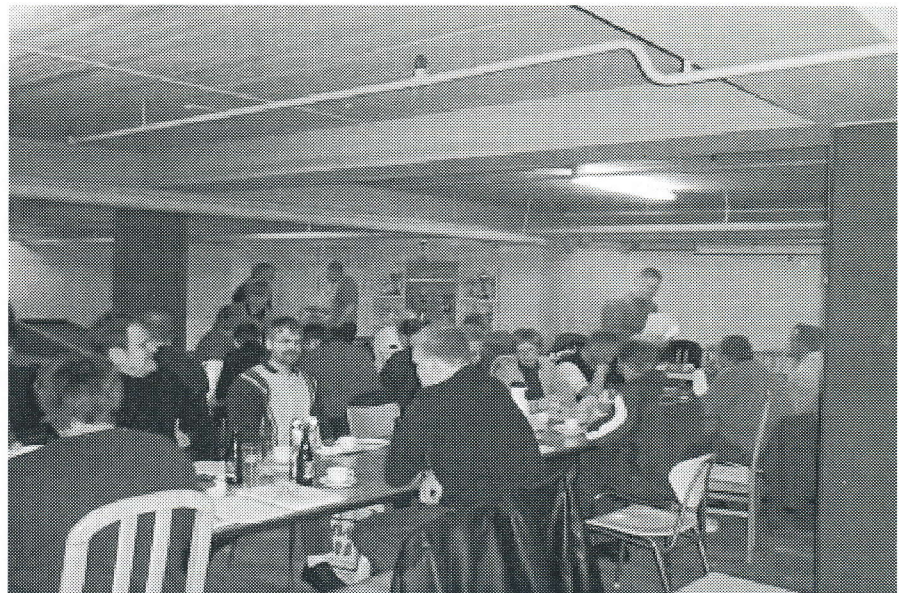
Fra repræsentantskabsmødet i Odense.

Derudover fik formandens beretning med eksternt indlæg om DBF også en del opmærksomhed samt landstrånerens beretning, hvor økonomien og udgifterne til elitearbejdet blev diskuteret ikke uden ris fra forsamlingen. Læs side 6-7.