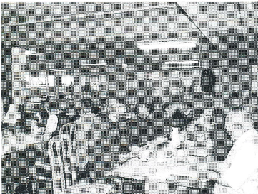
Et udsnit af repræsentantskabet på mødet i Odense.

Der spilles 6 afdelinger om året for eliten, mens øvrige divisioner spiller 5 afdelinger. Heraf ligger der 2 i efteråret.