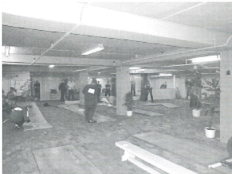
I forhold til at UIDM blev afviklet uden for sæsonen blev der vist fremragende spil af mange af de deltagende spillere.

næste år, og selvfølgelig gerne med flere hold.